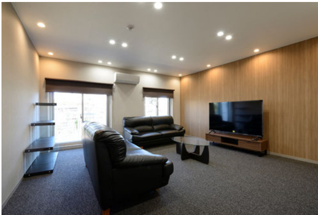
1号棟 多目的ラウンジ

1階の共用スペースには、サブリビングやワークルーム、多目的ラウンジ、浴室、フィットネスルームなど、既存の間取りと一部設備を活かしながら、老朽化の進んだ水回り設備を更新。多目的ラウンジにはパナソニック製スピーカー付ダウンライトを設置するなど、映画や音楽を満喫できるシアタースペースへ仕上げ、在宅勤務にも対応できるワークルームは、落ち着いた設えにしています。各寮室は、120室を維持したまま、ホテルライクな内装に加え、全室に内窓を設置して断熱性の向上を図りました。デスク、ベッド、ワードローブ(収納)等の家具をコーディネートしています。