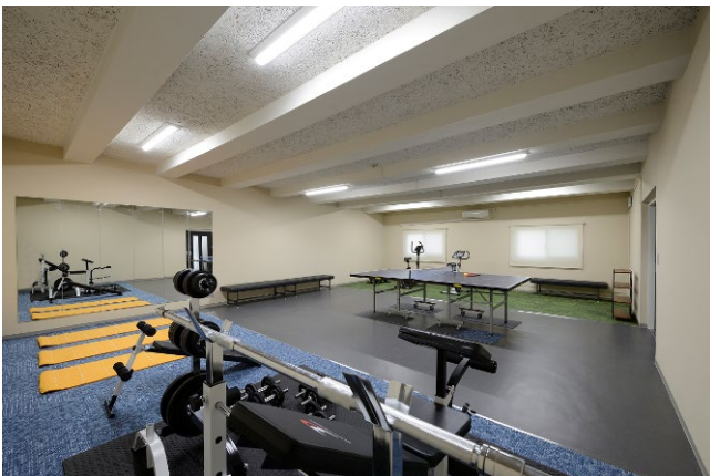
2号棟 フィットネスルーム