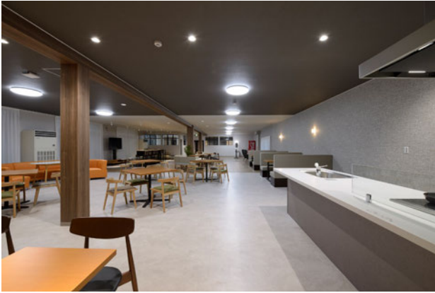
共用棟 メインリビング キッチンスペース