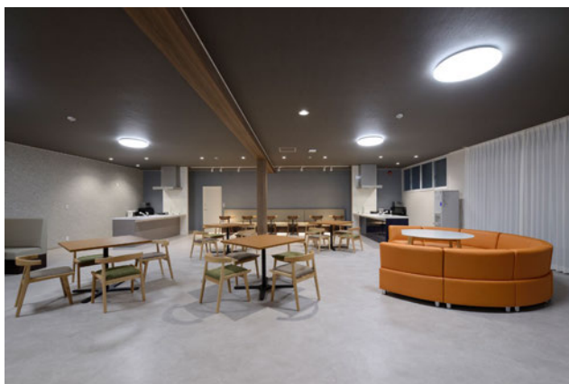
共用棟 メインリビング

玄関から寮室へ向かう廊下側にメインリビング内部を見渡せる室内窓を設け、開放的な空間にしました。リビング奥にはゆるやかにゾーン分けしたキッチンスペース、ダイニング・リラククスコーナーなどを設け、「くつろぐ」、「食べる」、「遊ぶ」、「話す」といった思い思いの過ごし方が可能なカフェのような空間づくりにより、プライベートタイムでの交流も促す工夫を施しています。