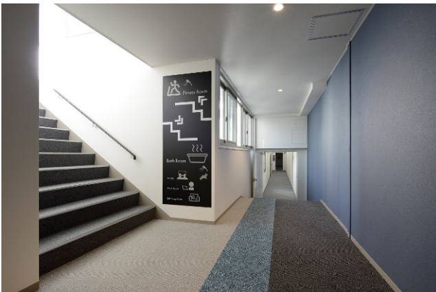
1・2号棟 ロケーションを示すピクトサイン