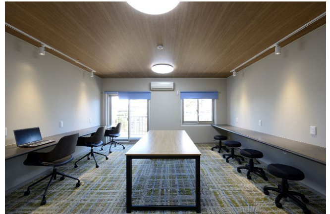
1号棟 ワークルーム